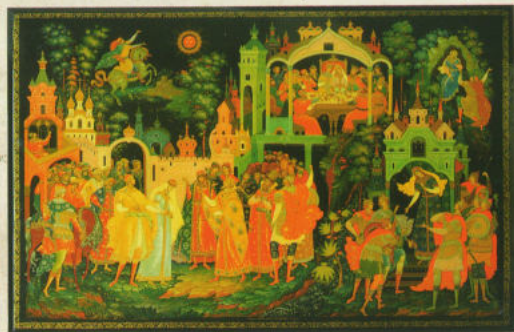
«Сказка о мертвой царевне и о семи богатырях» панно, 1992