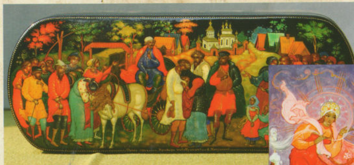
«Проводы новобранца», очешник, 1980