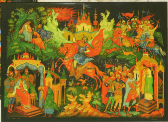
«Сказка о мёртвой царевне», шкатулка, 1980