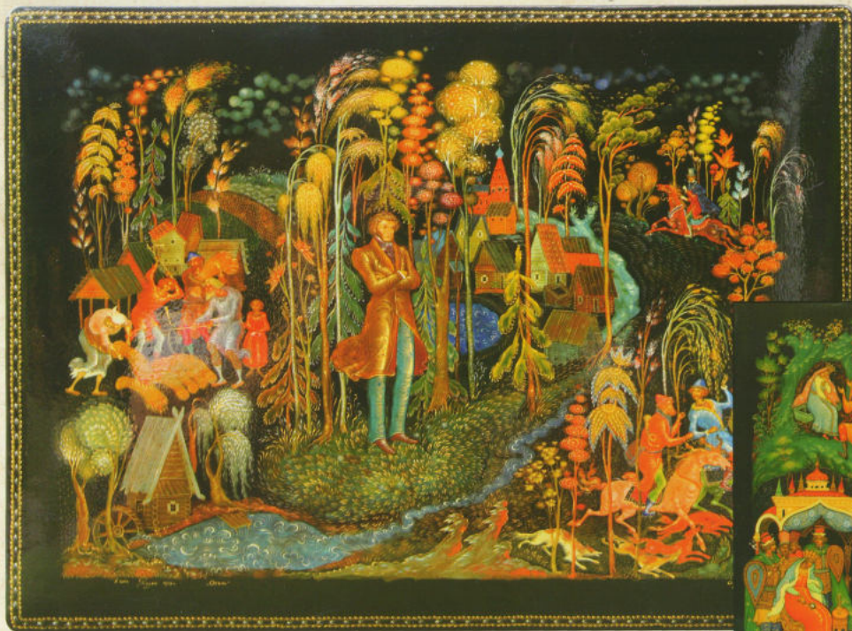
«Осень», шкатулка, 1973