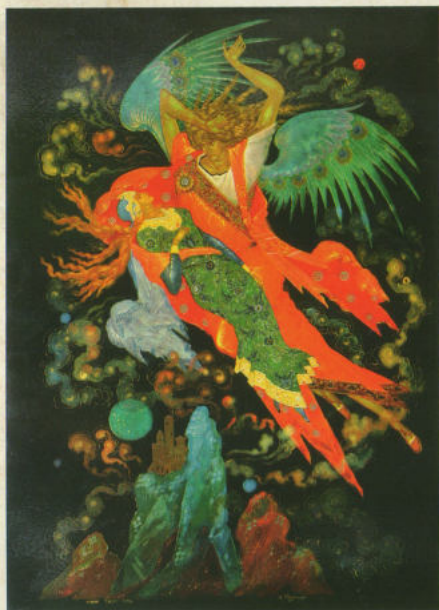
«Лунная соната», ларец, 2002