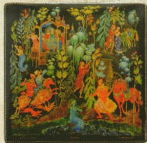
«Русалка», шкатулка, 1973