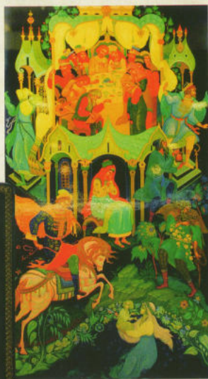
«Русалка», панно в Московском Государственном академическом Детском Музыкальном театре им. Н. Сац.