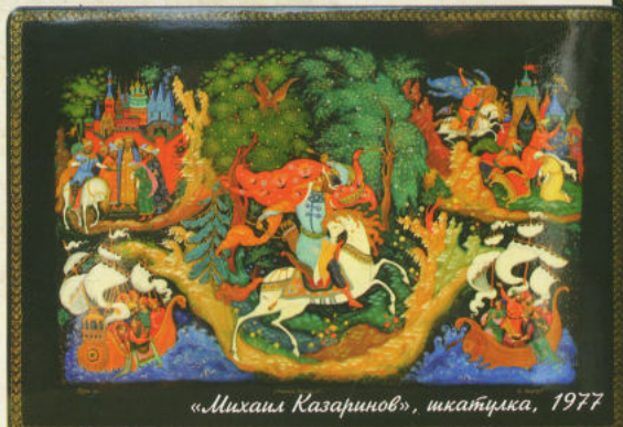
«Михаил Казаринов», шкатучка, 1977