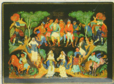
«Хороши наши ребята», шкатулка, 1976

Частушечные ритмы также не чужды фантазии художника. В коллекции ГМПИ хранятся шкатулка и ларчик «Хороши наши ребята», привлекающие живым, выразительным рисунком, яркой эмоциональной характеристикой персонажей.