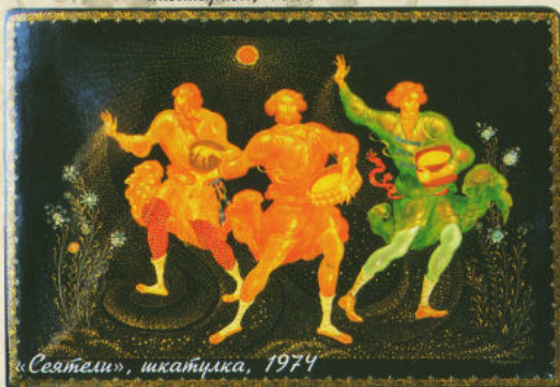
«Святел», шкатулка, 1974