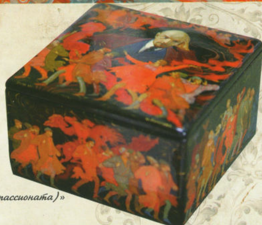
«Сквозь годы борьбы (Аппассионата)» ларец, 1969