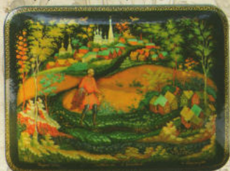
«Художник Н. М. Зиловьев», шкатулка, 1979