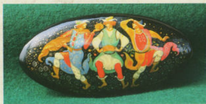
«Скорморахи», брошь, 1977