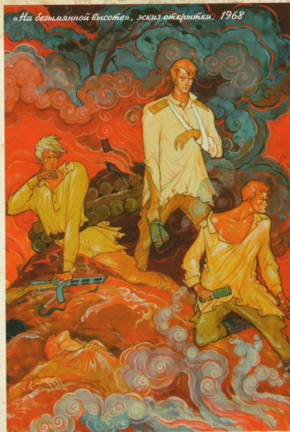
«На безымянной высоте», эскиз открытки, 1968