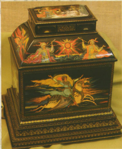
«Ход времени», лакец, 2003-2004