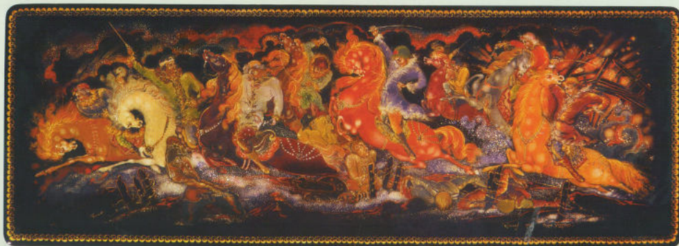
«Атака». Перчаточница, 1944 г. ГМПИ