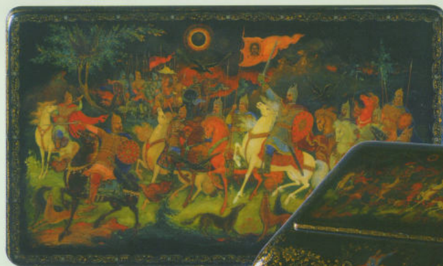
«Затмение солнца». Крышка ларца «Слово о полку Игореве».