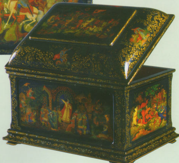
«Слово о полку Игореве». Ларец, 1956 г. ГМПИ