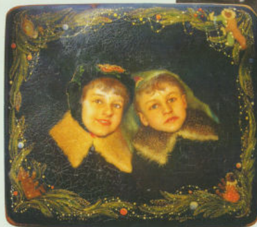
Портсигар с изображением детей, отправлен мужу на фронт в 1942 году.