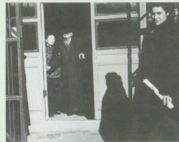
На встрече с классиком китайского искусства XX века Ци Бай Ши.