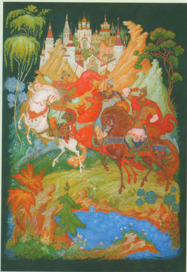
Эскиз монументального панно «Три богатыря» для загородной гостиницы «Ломы», 1978 г.