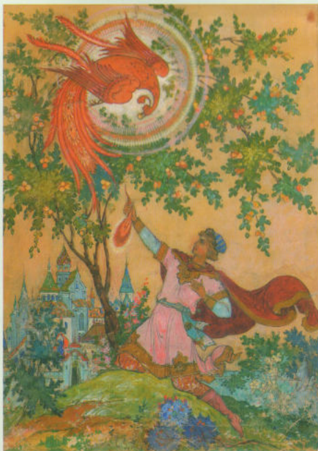
Эскиз стеновой росписи, 1958г.

Послевоенные годы принесли не только радость мира, но и счастье создания красоты на благо жизни. Стенная роспись, декорации к театральным постановкам, оформление журналов, праздничных открыток — все подвластно творческому темпераменту молодой художницы.