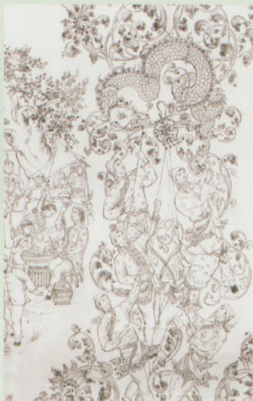
Фрагмент рисунка для лаковой вазы на тему «Праздник весны в Китае».