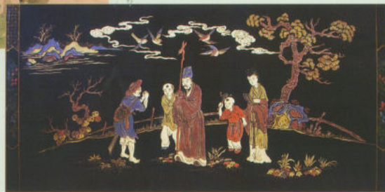
Панно, исполненное А.А.Котухиной в традиционной технике резьбы по лаку под руководством китайских мастеров.