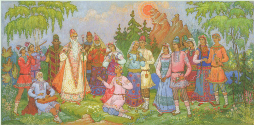
«Снегурочка». Эскизы росписи на холсте в палехском отделении ЗАГСа.