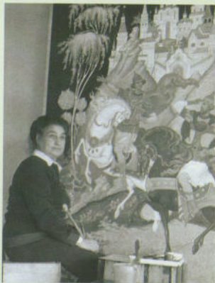
За работой над монументальным панно «Три богатыря» для загородной гостиницы «Ломы», 1978 г.