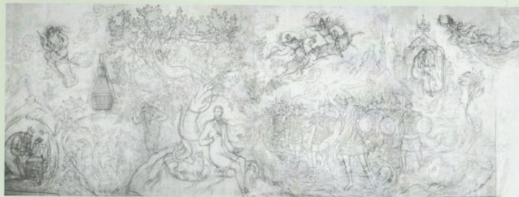
Эскиз стенной росписи «Лукоморье», 1970 г.

Тема Пушкина всегда была любимой для нескольких поколений палешан. Сказочность и яркость образов созвучна искусству Палеха.