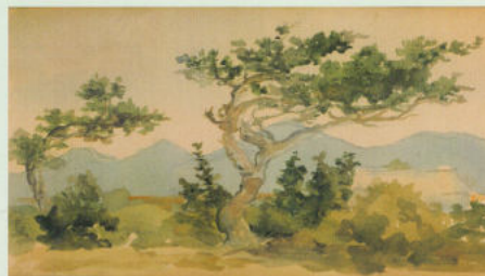
Остров Хайнань. Пейзаж с деревьями.