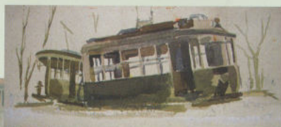
Зарисовки, сделанные в Сталинграде.