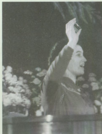
Выступление на конференции сторонников мира, 1951 г.

Не равнодушно, с искренним чувством говорила она о долге защитить землю от новых войн. Эта тема находит художественное воплощение не только в современных сюжетах, таких как композиция «За мир!», но и в глубоко символическом образном решении, ставшего классическим произведением палехского искусства ларце «Слово о полку Игореве».