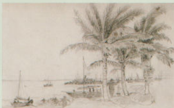
Чжэцзянь. Рыбачья гавань.