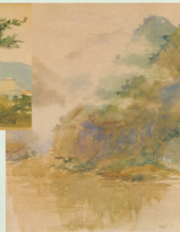
Юг Китая. Пейзаж в горах.