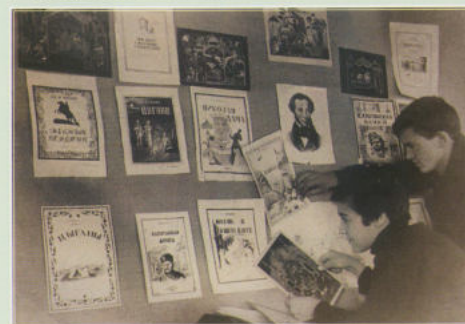
В профтехшколе за оформлением выставки.