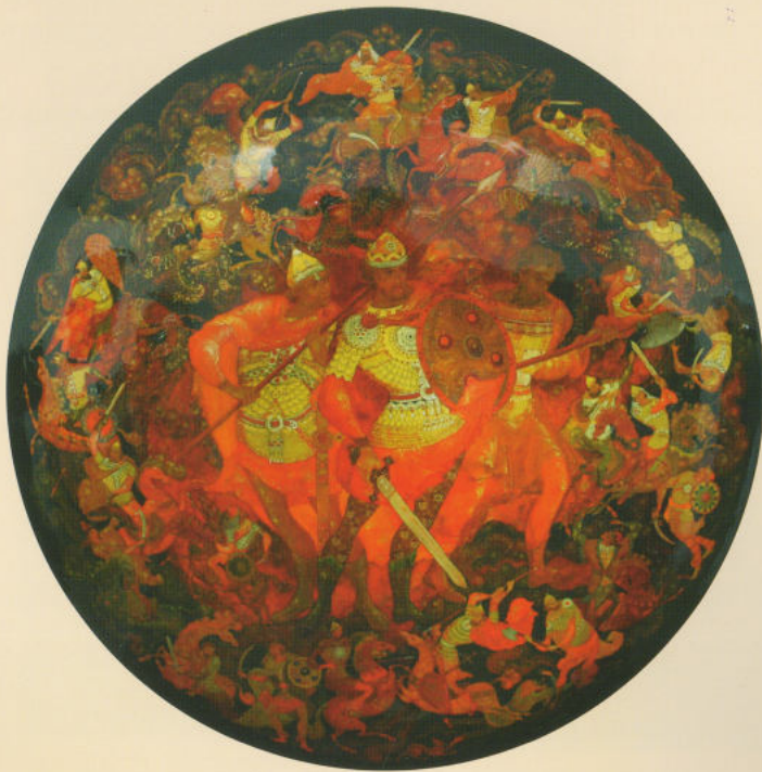
Панно «За Русь», 1974.