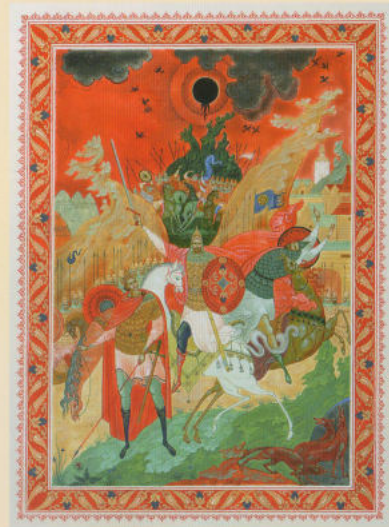
«Затмение». Иллюстрация для книги «Слово о полку Игореве» 2003.