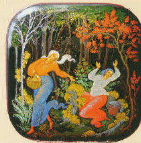
Шкатулка «Кругом опята - дружные ребята» 2011. Собственность автора