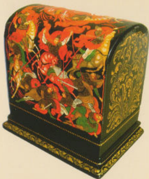
Ларец «Последняя битва», 2012. Собственность автора