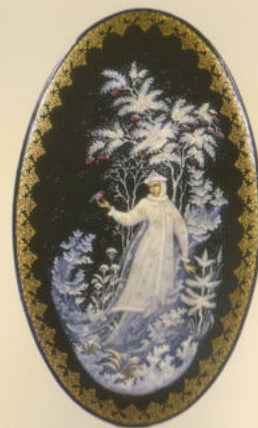
Баул «Снегурочка» 1998. Собственность автора

Более сложна для восприятия и передачи изобразительным языком народная сказка. В ней заложено глубокое символическое начало. Она хранит представления человека о порядке мироздания в доисторические времена, на заре цивилизации. Обращаются к русской народной сказке далеко не все палешане, а наиболее удачные сказочные образы-типы получили со временем и самое большое количество штампов в палехской миниатюре. В творчестве Н.П.Лопатина ближе всего к такому народному архетипу шкатулки «Царевна-лягушка» 2007 г. и «Сивка-Бурка» 2009 г., ларец «Летучий корабль» 2012 года. В миниатюрах же «Василиса» 2006 г., «Морозко» 2002 г. и 2011 г. символизация образов носит скорее личный, индивидуальный характер.