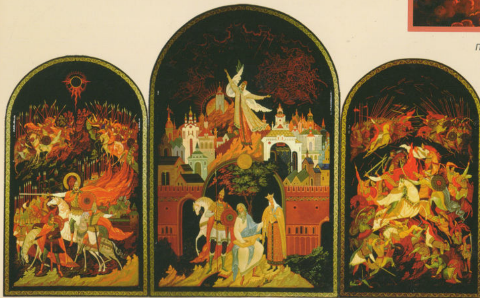
Панно «Слово о полку Игореве» 1989. Частная коллекция

Среди них Илья Муромец. Шкатулка «Илья Муромец» 1993 года является классическим вариантом палехской миниатюры. Традиционная многоклеймовая композиция органично вписана в вертикальный формат шкатулки. Алфавитной истиной можно назвать выразительные средства этого произведения: палатное письмо, горки, пластику фигур, колористическое решение. Показательным является и создание художественного образа в искусстве Палеха. В композиции нет сюжетного развития, отсутствуют временные и пространственные границы.