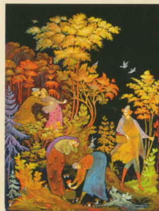
Шкатулка «Грибная осень» 2012. Собственность автора

и силуэтами. Объёмность им придаёт и активное моделирование золотом. В противоположном ключе решена декоративная задача при оформлении комплекта «Золотая осень» 2008-2011 г.г. Автором использованы приёмы греческих вазописцев: плоские золотые силуэты на чёрном фоне имеют орнаментально-графическую разделку деталей. Это относится и к растительным мотивам.