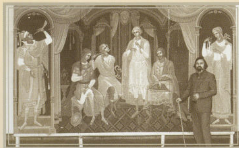
На обложке: «Жар-Птица» 2012. Собственность автора.