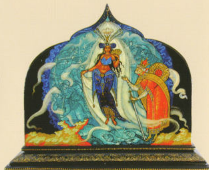
Салфетница «Золотой петушок» 2010. Собственность автора