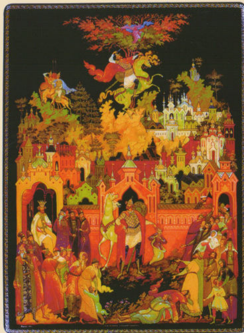
Шкатулка «Илья Муромец» 1993. ГМПИ

Ещё одна тема, связанная с героическим эпосом, волнует Н.П.Лопатина на протяжении многих лет – «Слово о полку Игореве». Пластина-триптих 1989 года представляет вполне классический вариант «Слова» в истории палехского искусства. Традиционно представлены любимые палеханами эпизоды: «Плач Ярославны», «Затмение», «Битва Игоря Святославовича с половцами». Индивидуальную окраску произведению придают особенности творческой манеры художника: эпическая монументализация образа, пластические и колористические приёмы. Ларец «Слово о полку Игореве» 1991 года – это более глубокое личностное прочтение текста древнерусского эпоса. Живопись выполнена на тёмно-красном фоне. Волнующе, драматично представлена Ярославна на крышке ларца. Палехский мастер изображает не просто плач, состояние горя покинутой женщины, а предвестие вселенской трагедии, но бelyй плащ Ярославны, как крылья ангела, готового остановить беду. Иконописные традиции, прежде всего приёмы древнерусской книжной миниатюры, использованы художником при создании иллюстраций для книги «Слово о полку Игореве» в 2003 году.