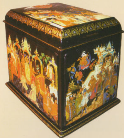
Ларец «Летучий корабль» 2012. Собственность автора