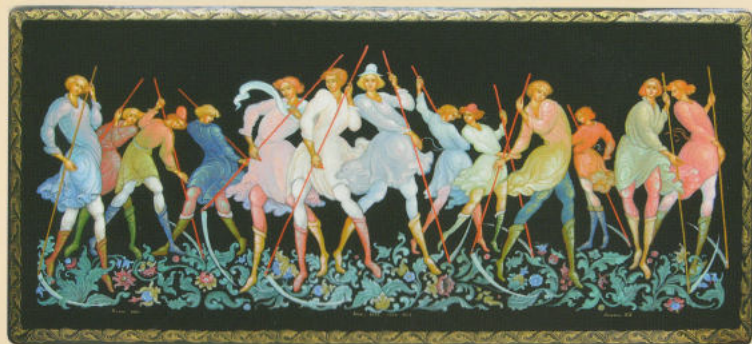
Шкатулка «Коси, коса, пока роса» 2011. Собственность автора

Оформление вещи является основной целью мастера и в некоторых произведениях на тему праздника, танцевальную тему. Техническая виртуозность, согласованность живописи с формой предмета характерны для композиций «Праздничная» 2010 г. на салфетнице, «Пляска» 2010 г. на овальном подносе, «Перепляс» 2011 г. на бауле, «Снежная круговерть» 2012 г. на пластине. Упругий ритм кругового движения становится основой орнаментальной композиции «Танец» (Рапсодия) 2002 г., где каждая деталь оказывается на своём месте. Фигуры, удивительно пластичные и грациозные, свободно вписаны в изобразительное пространство шкатулки с закруглёнными краями. Декоративное звучание миниатюры усиливает красно-оранжевый цвет на чёрной поверхности лака, имеющий разную тональность в тенях и светах, отчего фигуры не выглядят плоскими