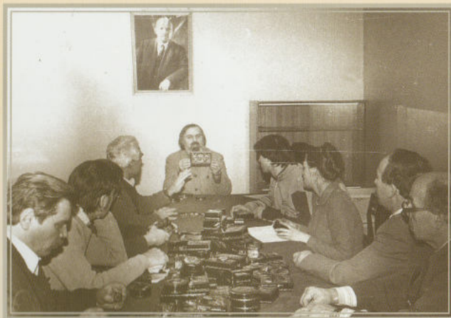
Заседание худсовета, 1980-е, Палех