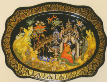
Поднос «Людмила в саду Черномора» 2012. Собственность автора

Некоторые палехские художники, осознавая необходимость перемен, как в своё время основоположники лаковой миниатюры, ищут ответы на свои вопросы в лучших образцах палехской иконописи. По примеру знаменитых акафистных циклов Николай Павлович Лопатин создаёт три грандиозных композиции – «Сказка о царе Салтане» 1993 г., «Сказка о мёртвой царевне» 1994 г., «Руслан и Людмила» 1995 г. Каждая миниатюра в этих сложнейших композиционных замыслах по-своему уникальна и в то же время является лишь частью целого. Фантазия художника, подкреплённая оригинальными находками старых мастеров, рождает новые, ещё более причудливые формы горок, архитектуры, усложняет композиционные ритмы.