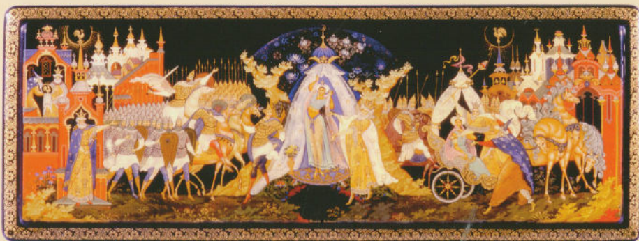
Шкатулка «Сказка о Золотом петушке» 1998. ГМПИ