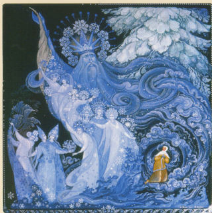
Шкатулка «Морозка» 2002. Частная коллекция