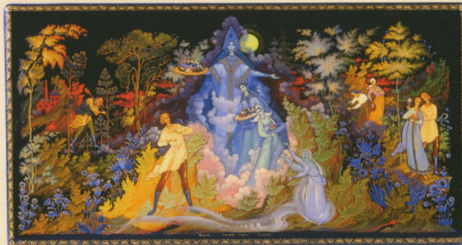
Шкатулка «Синюшкин колодец» 1992. Частная коллекция

Образ творческой личности волнует многих художников на протяжении нескольких веков, в том числе и палешан. Н.П.Лопатин посвятил этой теме ларец «Художник Палеха», написанный им в 2004 году. Форма ларца соответствует многомерному образу мира. Погружение в себя, отрешенность и сосредоточенность отражены в одинокой фигуре художника на крышке ларца. Без вмешательства Божественного промысла человеку трудно представить творческий процесс. Поэтому на откосах крышки под покровом крыльев ангелов в максимально светлом колорите изображается тонкая духовная субстанция рождающихся фантазий. Образ жизни палехских мастеров тесными узлами связан с природой. Композиции на стенках ларца представляют четыре времени года. Традиционный условный пейзаж, сюжетные сцены труда и отдыха отражают