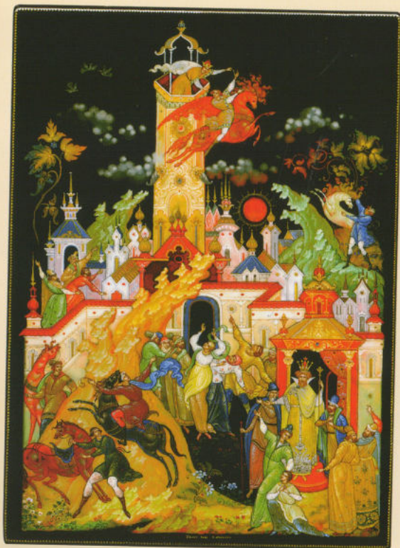
Шкатулка «Сивка-Бурка» 2009. Собственность автора