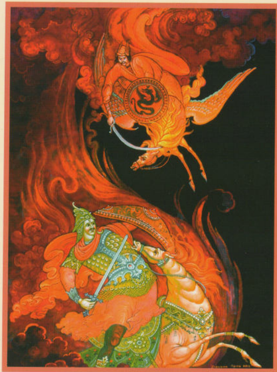
Пластина «Алеша Попович и Тугарин Змеевич» 2012. Собственность автора