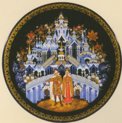
Тарелка «Чудо-город» 1997. Частная коллекция