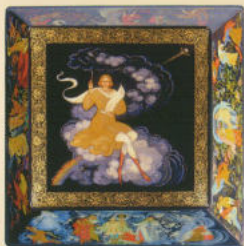
Ларец «Художник Палеха» 2004. Собственность автора