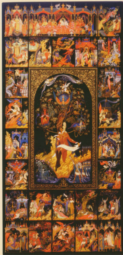
Пластину «Руслан и Людмила» 1995. Частная коллекция

Работает художник и над отдельными образами и эпизодами пушкинских произведений. В разные годы появляются композиции «Чудо-город», «Чудо-Белка», «Гвидон», «Руслан», «Королевич Елисей», «Людмила в саду Черномора» и др. Несомненным вкладом в палехскую пушкинскую миниатюру являются миниатюры на тему «Сказки о золотом петушке», в которых Н.П.Лопатин создаёт незабываемый образ Шамаханской царицы.