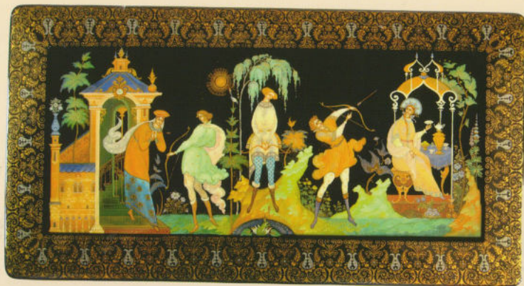
Шкатулка «Царевна-лягушка» 2007. Собственность автора