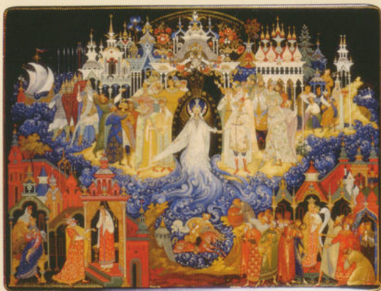
Шкатулка «Сказка о царе Салтане» 1999. ГМПИ