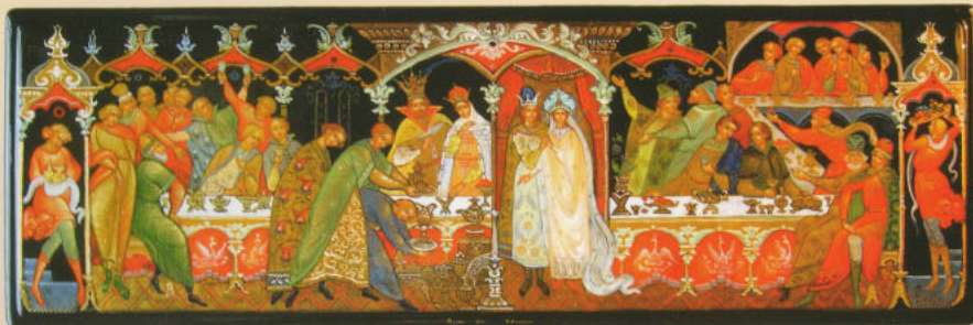
Шкатулка «Пир на острове Буяне» 2012. Собственность автора