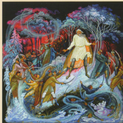
Шкатулка «Иван Сусанин 2012. Состительность автора