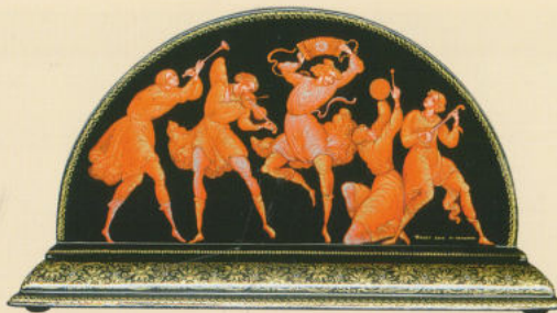
Салфетница «Праздничная» 2010. Собственность автора