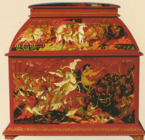
Ларец «Слово о полку Игореве» 1991. Частная коллекция