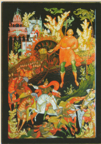
Пластина «Вольга и Микула» 2012. Соственность автора