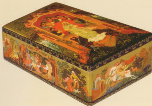
Шкатулка «Сказки о мертвой царевне» 1979. ГМПИ