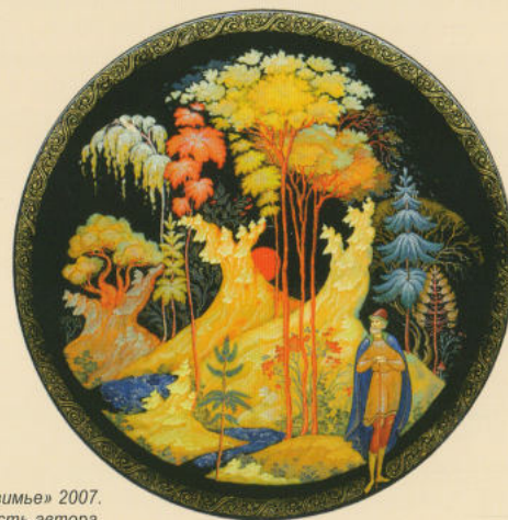
Тарелка «Осень. Предзимье» 2007. Собственность автора.

жизненный уклад палешан. И как часть этого бытия - художник. Его фигура своим масштабом сразу привлекает внимание, но нигде не противостоит целостному гармоничному миру. В этом жизненном укладе, гении места и заключается уникальность палехского искусства, особенность образного видения многих местных мастеров. Философское размышление о предназначении человека представлено Н.П.Лопатиным в цикле работ 2011 года: «Весна. Пробуждение», «Лето. Жизнь», «Осень. Предзимье», «Зима. Покой». Жизнь человека, по мнению автора, также циклична, как и жизнь природы, но быстротечна. В композициях на разных по форме предметах преобладает символическое начало, отражающее процесс одухотворения земного бытия. Выразительность силуэтов, жестов становится основным средством в создании художественного образа. Человек не является здесь частью идеального мира, он или отрешенный сторонний наблюдатель, или властитель, преобразователь мира.